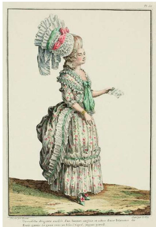
6. Galerie des modes..., s. 114.