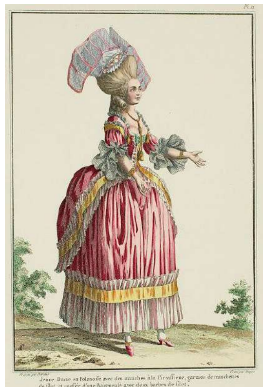
2. Galerie des modes... s. 80.