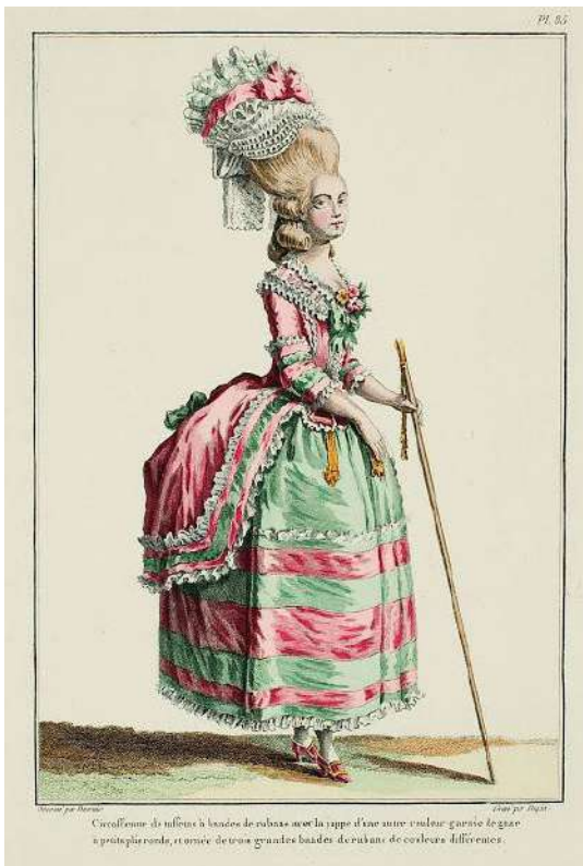
5. Galerie des modes..., s. 217.