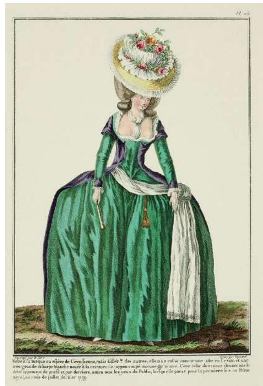
8. Galerie des modes..., s. 277.