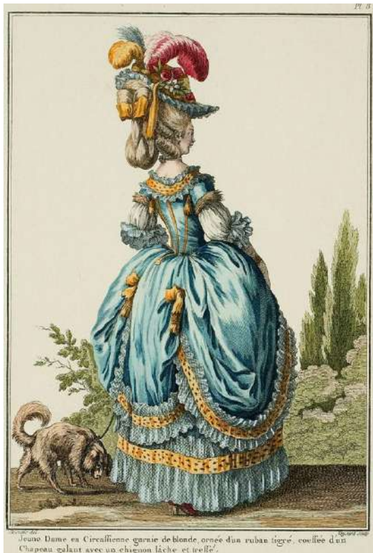
1. Galerie des modes... s. 53.