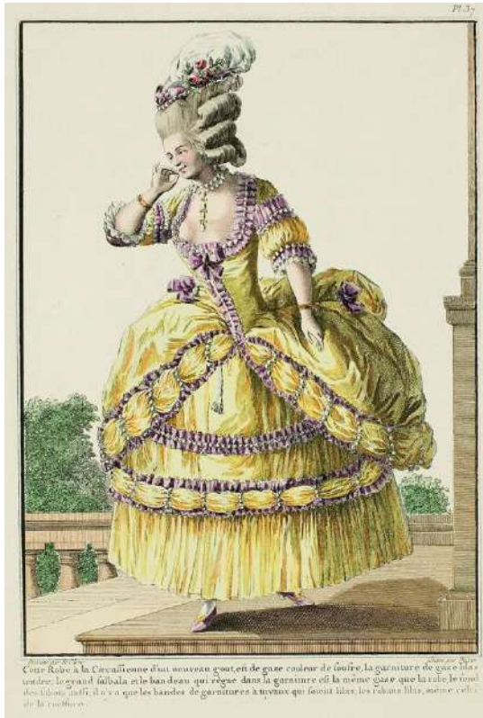
3. Galerie des modes..., s. 114.