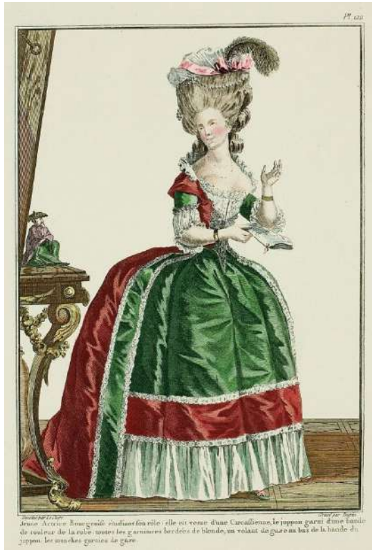
7. Galerie des modes..., s. 293.