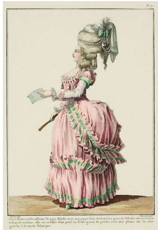
4. Galerie des modes..., s. 122.