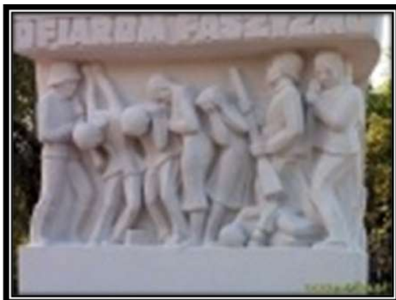
3. http://www.potulice.pl/galerie-zdjec/potulice/pomnik-ofiar-porenowacji/pomnik-ofiar-id550.html [dostęp: 17.07.2013].