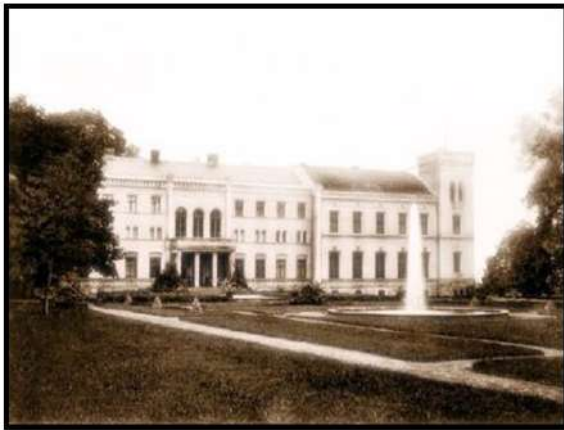
2. http://www.potulice.pl/potulice/zespol-palacowo-parkowy.htm [dostęp: 17.07. 2013].